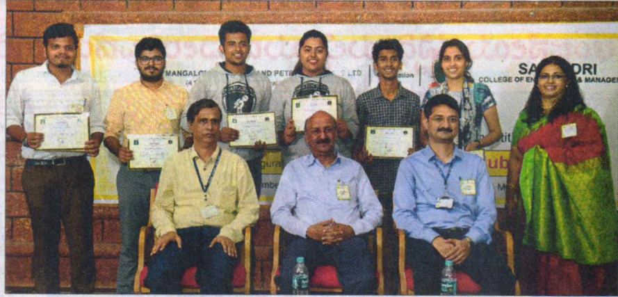
ಮಂಗಳೂರು: ಎಂಆರ್‌ಪಿಎಲ್-ಸಹ್ಯಾದ್ರಿ ಇಂಟರ್ ಪ್ರೊಫೆಷನಲ್ ಕಾಲೇಜಿಯೇಟ್ ಚರ್ಚಾ ಸ್ಪರ್ಧೆ ಗುರುವಾರ ಜರಗಿತು.

ಎಂಆರ್‌ಪಿಎಲ್ ಹಾಗೂ ಸಹ್ಯಾದ್ರಿ ಕಾಲೇಜ್ ಆಫ್ ಎಂಜಿನಿಯರಿಂಗ್ ಆಂಡ್ ಮ್ಯಾನೇಜ್‌ಮೆಂಟ್ ಸಹ ಯೋಗದೊಂದಿಗೆ ಆಯೋಜಿಸಿದ್ದ ನನ್ನ ದೃಷ್ಟಿ ಭ್ರಷ್ಟಾಚಾರ ಮುಕ್ತ ಭಾರತ ವಿಷಯದಲ್ಲಿ ಎಂಆರ್‌ಪಿಎಲ್-ಸಹ್ಯಾದ್ರಿ ಇಂಟರ್ ಪ್ರೊಫೆಷನಲ್ ಕಾಲೇಜಿಯೇಟ್ ಚರ್ಚಾ ಸ್ಪರ್ಧೆಯ ಸಮಾರೋಪದಲ್ಲಿ ಮುಖ್ಯ ಅತಿಥಿಯಾಗಿ ಭಾಗವಹಿಸಿ ಮಾತನಾಡಿದ ಅವರು, ಭ್ರಷ್ಟಾಚಾರ ಬಹುದೊಡ್ಡ ಪಿಡುಗು. ಪಾರದರ್ಶಕತೆ, ವ್ಯವಸ್ಥೆಯಲ್ಲಿ ತಂತ್ರಜ್ಞಾನಗಳ ಅಳವಡಿಕೆ ಹಾಗೂ ಜಾಗೃತಿಯಿಂದ ಭ್ರಷ್ಟಾಚಾರ ನಿಯಂತ್ರಿಸಲು ಸಾಧ್ಯ. ವಿದ್ಯಾರ್ಥಿ ಸಮುದಾಯ ಇದರಲ್ಲಿ ಸಕ್ರಿಯ ವಾಗಿ ತೊಡಗಿಸಿಕೊಳ್ಳಬೇಕು ಎಂದರು. ಚರ್ಚಾ ಸ್ಪರ್ಧೆಯಲ್ಲಿ ವಿಜೇತರಾದವರನ್ನು ಅವರು ಅಭಿನಂದಿಸಿದರು.